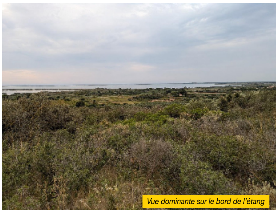
Vue dominante sur le bord de l'étang

Dès lors la présence allemande sera tournée vers cette vocation : la protection de la façade maritime. Sur toute la côte, des dispositifs défensifs ( aux frais de la France ) vont s'implanter