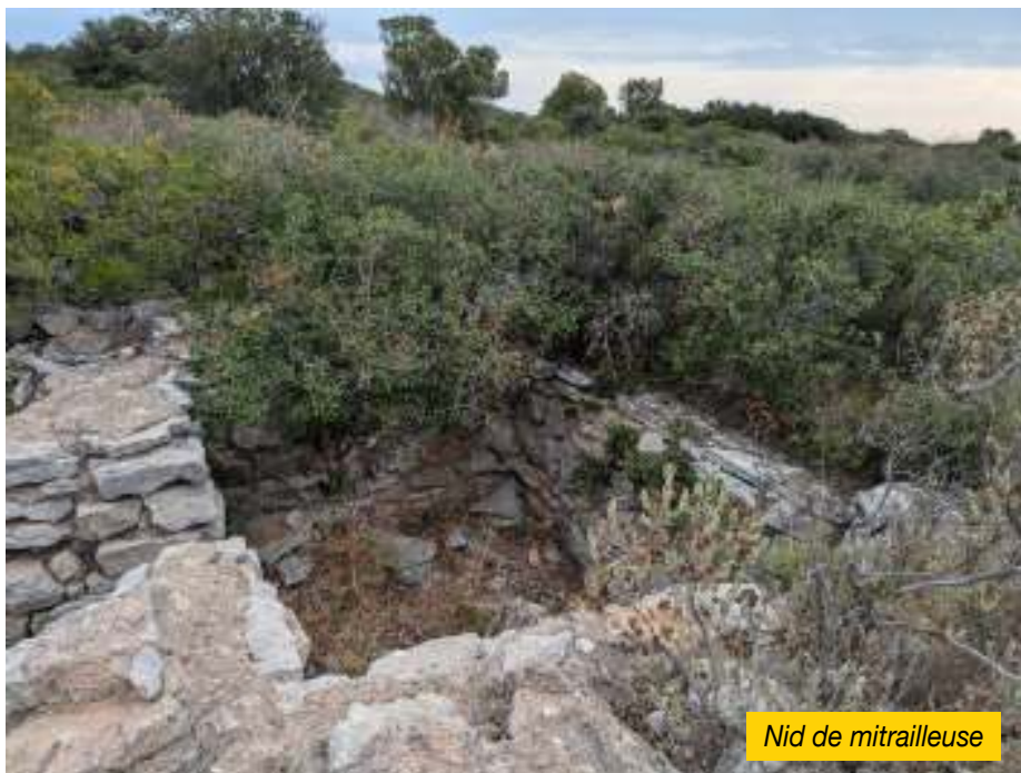
Nid de mitrailleuse

Ce n'est que lorsque l'Allemagne envahira la zone libre le 11 novembre 1942 que les Mirevalais découvriront