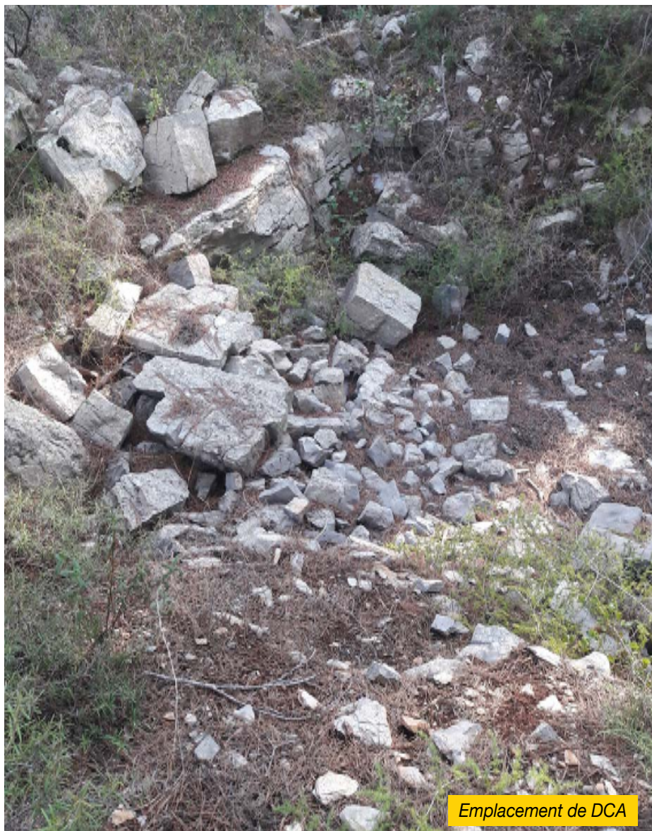
Emplacement de DCA

repli se fait en catastrophe, l'Occupant ne fonctionnant jusqu'alors que par réquisition des moyens de transport et de déplacement, même pour les opérations militaires contre les maquis. Ils abandonnent nombre de supplétifs ( de l'Est et d'Afrique du Nord notamment ). Ceux-là, devenus vulnérables et à la recherche éperdue d'un moyen de déplacement quelconque, pouvaient se montrer dangereux pour la population.