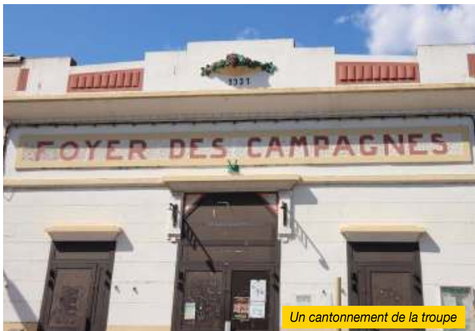
Un cantonnement de la troupe