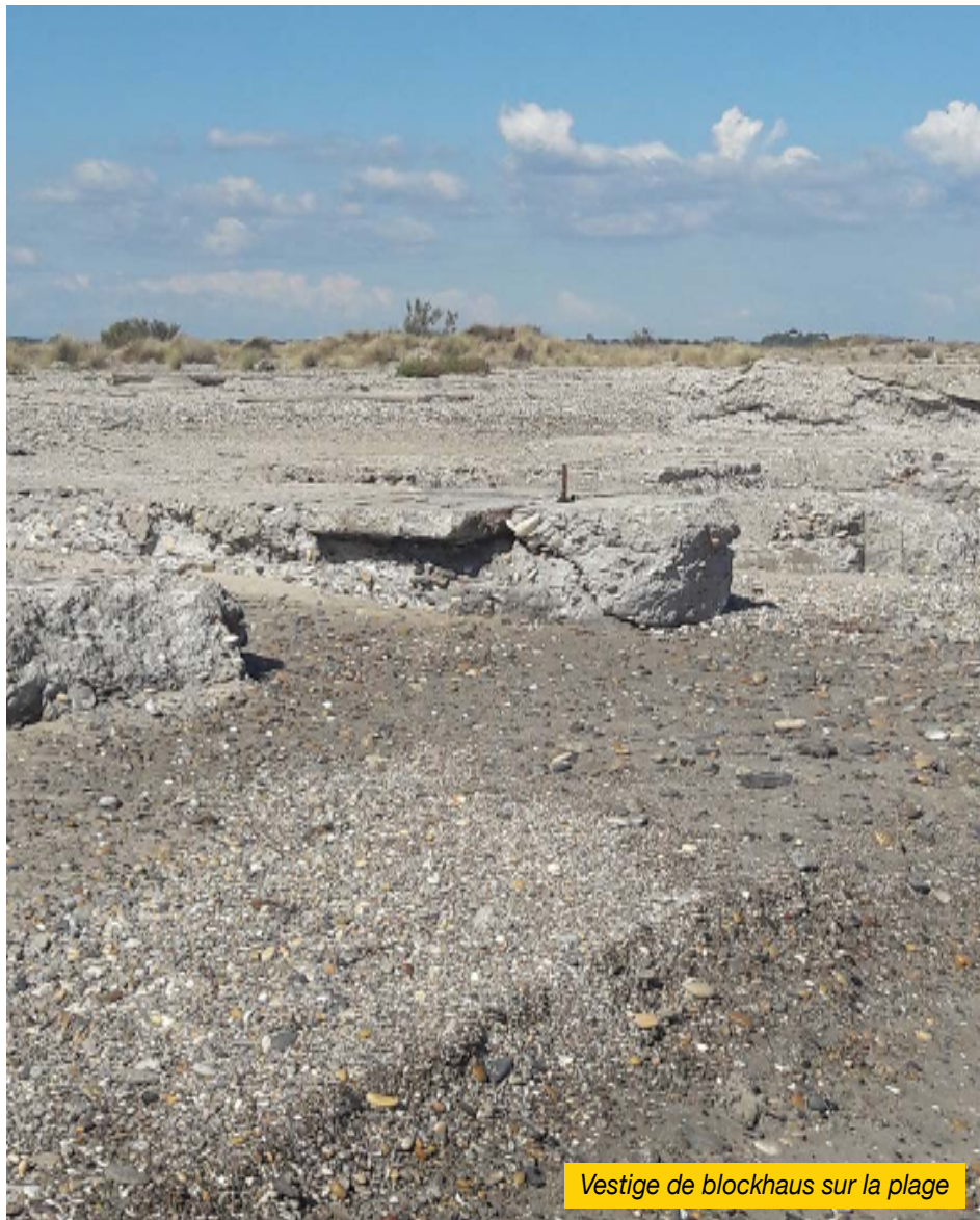
Vestige de blockhaus sur la plage

Des nids de mitrailleuses seront construits sur les premiers contreforts dominant l'étang de Vic : il en reste un, bien conservé, à gauche de l'entrée du Creux de Miège. Il contrôle la route